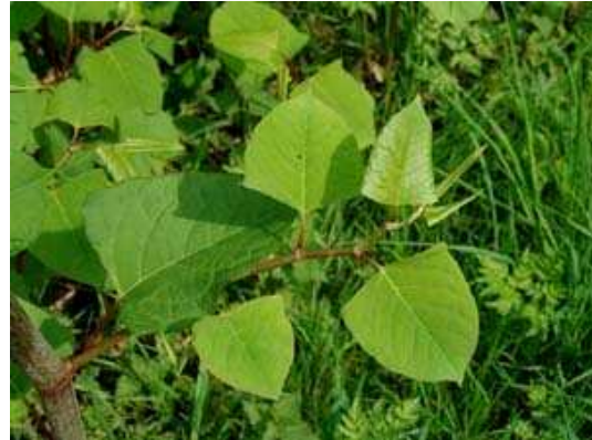
Photos de Renouée du Japon